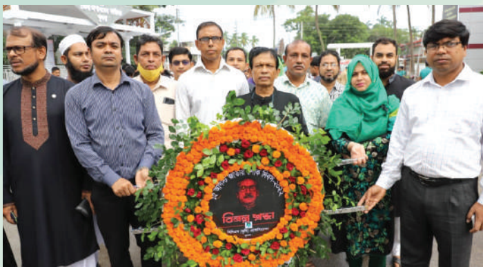
খুলনা অঞ্চলের পক্ষ থেকে শ্রদ্ধাঞ্জলি