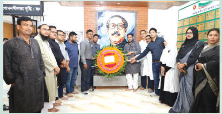
কৃষি তথ্য সার্ভিসের প্রধান কার্যালয়ের পক্ষ থেকে শ্রদ্ধাঞ্জলি