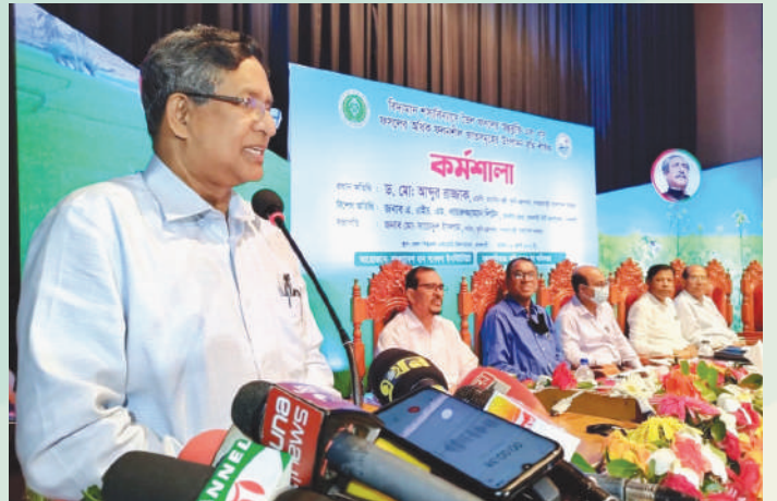
রাজশাহী শিল্পকলা একাডেমি মিলনায়তনে বরেন্দ্র অঞ্চলে তেল ফসল ও ধানের উৎপাদন বৃদ্ধি শীর্ষক কর্মশালায় বক্তব্য রাখছেন মাননীয় কৃষিমন্ত্রী ড. মোঃ আব্দুর রাজ্জাক এমপি

রোববার বিকেলে রাজধানীর খামারবাড়িতে বিএআরসি মিলনায়তনে বন্যায় ক্ষতিগ্রস্ত কৃষকদের মাঝে বিনামূল্যে বীজ বিতরণ অনুষ্ঠানে মাননীয় কৃষিমন্ত্রী এরপর পৃষ্ঠা ৭ কলাম ১