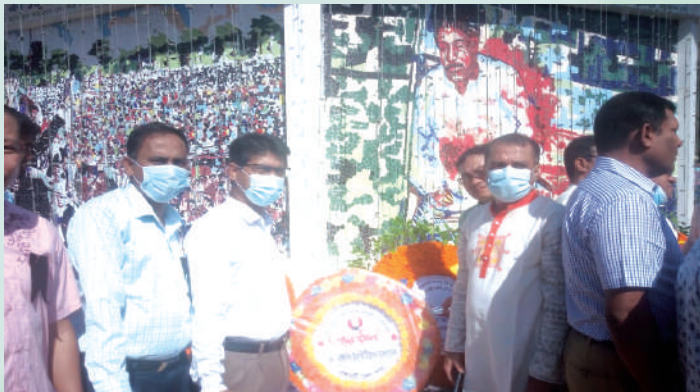
রাঙ্গামাটি জেলা শাখার পক্ষ থেকে বিনম্র শ্রদ্ধা