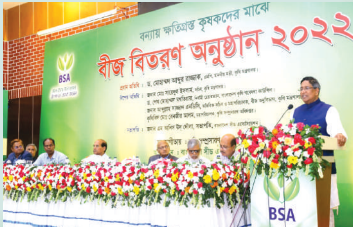
মাননীয় কৃষিমন্ত্রী ড. মোঃ আব্দুর রাজ্জাক এমপি বিএআরসি মিলনায়তনে বীজ বিতরণ অনুষ্ঠানে বক্তব্য রাখছেন

খাদ্যের জন্য কোনক্রমেই বিদেশের ওপর নির্ভরশীল থাকা যাবে না : মাননীয় কৃষিমন্ত্রী