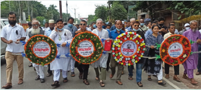
রংপুর অঞ্চলের পক্ষ থেকে গভীর শ্রদ্ধাঞ্জলি