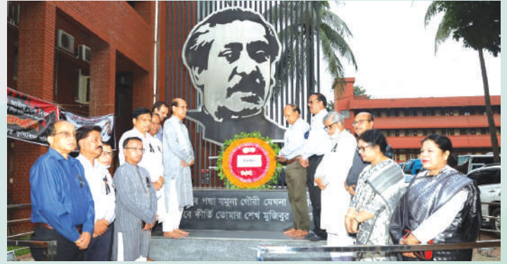
ঢাকায় বিএআরসি প্রাঙ্গণে কৃষি মন্ত্রণালয়ের পক্ষ থেকে বিনম্র শ্রদ্ধা