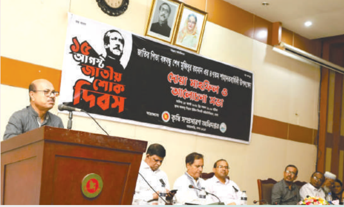
ঢাকায় আকামু গিয়াস উদ্দিন মিলকী অডিটোরিয়ামে কৃষি সম্প্রদায় অধিদপ্তরের আয়োজনে দোয়া মাহফিল ও আলোচনা সভা

১৫ আগস্ট ২০২২ জাতির পিতা বঙ্গবন্ধু শেখ মুজিবুর রহমানের ৪৭তম শাহাদতবার্ষিকী ও জাতীয় শোক দিবস উপলক্ষে দেশব্যাপী কৃষি মন্ত্রণালয়ের বিভিন্ন দপ্তর, সংস্থা ও পেশাজীবী সংগঠন বঙ্গবন্ধুর প্রতিকৃতিতে পুষ্পস্তবক অর্পণ এবং দোয়া ও আলোচনা সভা অনুষ্ঠিত