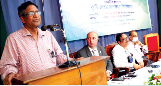
কুমিল্লা বার্ডে অনুষ্ঠিত কর্মশালায় বক্তব্য রাখেন প্রধান অতিথি মাননীয় কৃষিমন্ত্রী ড. মোঃ আব্দুর রাজ্জাক এমপি

কৃষি মন্ত্রণালয় এবং জাতিসংঘের খাদ্য ও কৃষি সংস্থা (এফএও) এর আয়োজনে, ৭ আগস্ট ২০২২ বাংলাদেশ পল্লী উন্নয়ন একাডেমি (বার্ড), কুমিল্লা এর কনফারেন্স হলে, কৃষি সেক্টর রূপান্তরে বিনিয়োগ শীর্ষক আঞ্চলিক কর্মশালা অনুষ্ঠিত হয়। কর্মশালায় প্রধান অতিথির বক্তব্য রাখেন, মাননীয় কৃষিমন্ত্রী ড. মোঃ আব্দুর রাজ্জাক এমপি।