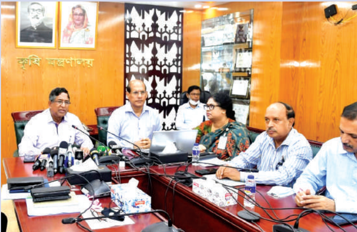
সচিবালয়ে মন্ত্রণালয়ের সম্মেলন কক্ষে সাংবাদিকদের সাথে মতবিনিময়কালে মাননীয় কৃষিমন্ত্রী ড. মোঃ আব্দুর রাজ্জাক এমপি

মাননীয় কৃষিমন্ত্রী ও আওয়ামী লীগের প্রেসিডিয়াম সদস্য ড. মোঃ আব্দুর রাজ্জাক এমপি বলেছেন, আমরা ইউরিয়া সারের ব্যবহার হ্রাস ও ডিএপি সারের ব্যবহার বৃদ্ধিতে গুরুত্বারোপ করে যাচ্ছি। ডিএপি সার