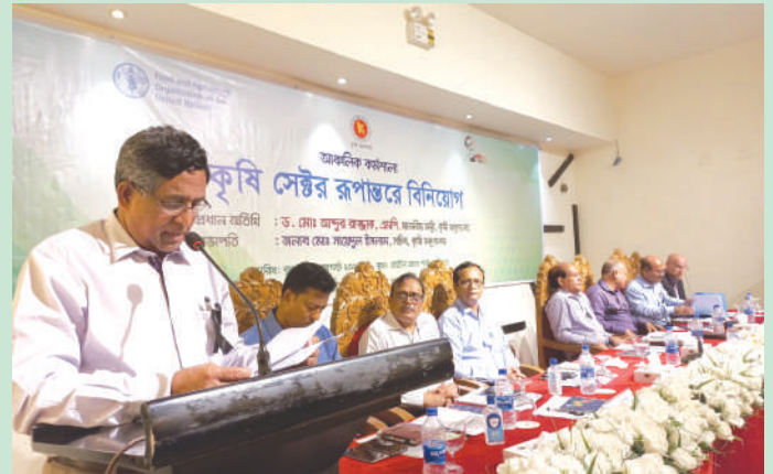
কর্মশালায় প্রধান অতিথির বক্তব্য রাখছেন মাননীয় মন্ত্রী ড. মোঃ আব্দুর রাজ্জাক এমপি, কৃষি মন্ত্রণালয়

কৃষির সকল সেক্টরকে বিবেচনায় নিয়েই ভবিষ্যতের কান্ডি ইনভেস্টমেন্ট প্লান করা হবে বলে নিশ্চিত করেছেন মাননীয় কৃষিমন্ত্রী ড. মোঃ আব্দুর রাজ্জাক এমপি। ৩ আগস্ট ২০২২ বরিশালের