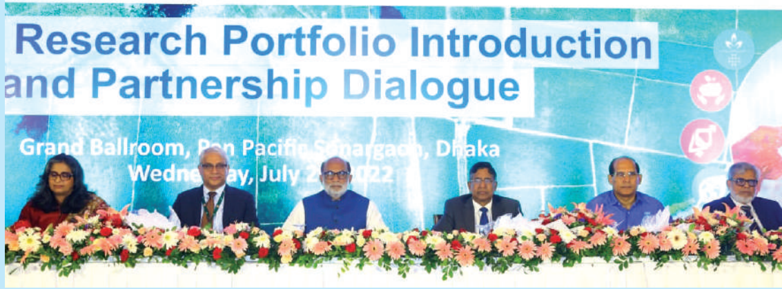
সোনারগাঁওয়ে কনসাল্টেটিভ গ্রুপ ফর ইন্টারন্যাশনাল এগ্রিকালচার রিসার্চে (সিজিআইএআর) গবেষণা কার্যক্রমের পরিচিতি ও বাংলাদেশের সাথে অংশীদারিত্ব নিয়ে সংলাপে মাননীয় কৃষিমন্ত্রী ড. মোঃ আব্দুর রাজ্জাক এমপি প্রধান অতিথি হিসাবে উপস্থিত ছিলেন

মাননীয় কৃষিমন্ত্রী ড. মোঃ আব্দুর রাজ্জাক এমপি বলেন বিগত ৫০ বছরে চালের উৎপাদন বেড়েছে প্রায় চার গুণ। প্রধানমন্ত্রী শেখ হাসিনার নেতৃত্বে বর্তমান কৃষিবান্ধব সরকার কর্তৃক সার, বীজসহ কৃষি উপকরণে বিশাল ভর্তুকি, কৃষিযন্ত্রে ভর্তুকি, গবেষণায় পর্যাপ্ত বরাদ্দ, বন্যা, খরাসহ বিভিন্ন প্রাকৃতিক