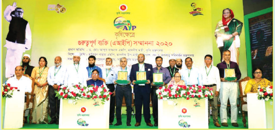
কৃষিক্ষেত্রে গুরুত্বপূর্ণ ব্যক্তি (এআইপি) সম্মাননা ২০২০ উপলক্ষে রাজধানীর ওসমানী স্মৃতি মিলনায়তনে মাননীয় কৃষিমন্ত্রী ড. মোঃ আব্দুর রাজ্জাক এমপি প্রধান অতিথি হিসেবে উপস্থিত ছিলেন

এসময় মাননীয় কৃষিমন্ত্রী বলেন, দেশের কৃষির সাফল্যের অন্যতম এরপর পৃষ্ঠা ৭ কলাম ৩