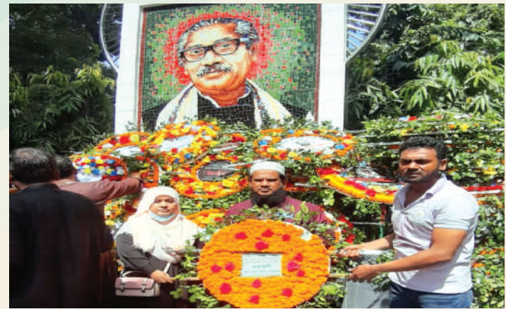
আঞ্চলিক কৃষি তথ্য সার্ভিস কুমিল্লা পক্ষ থেকে বিনম্র শ্রদ্ধা