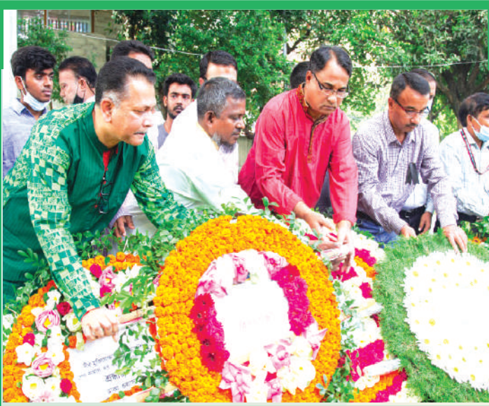
জাতির পিতা বঙ্গবন্ধু শেখ মুজিবুর রহমান এর জ্যেষ্ঠ পুত্র বীর মুক্তিযোদ্ধা শহিদ ক্যাপ্টেন শেখ কামালের ৭৩তম জন্মবার্ষিকীতে কৃষি মন্ত্রণালয়ের কর্মকর্তা-কর্মচারীদের শ্রদ্ধা নিবেদন।