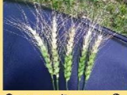
চিত্র ২: ব্লাস্টে আক্রান্ত শীষ