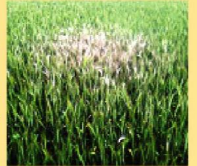
চিত্র ১: গমের ক্ষেতে ব্লাস্টের প্রাথমিক লক্ষণ