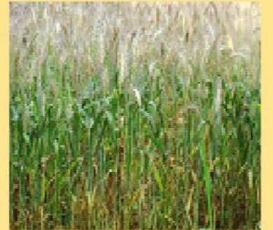
চিত্র ২: পুরো ক্ষেত আক্রান্ত লক্ষণ