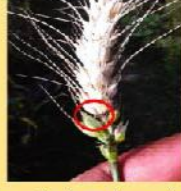
চিত্র ২: আক্রান্ত স্থানে কালো দাগ