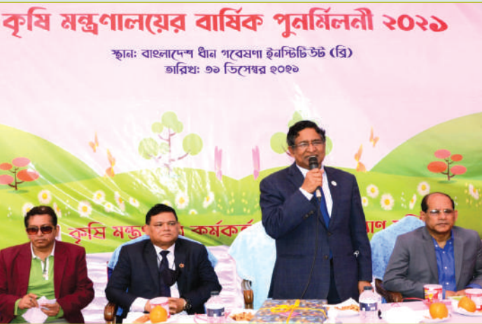
কৃষি মন্ত্রণালয় আয়োজিত মন্ত্রণালয়ের বার্ষিক পুনর্মিলনীতে বক্তব্য রাখছেন মাননীয় কৃষিমন্ত্রী ড. মোঃ আব্দুর রাজ্জাক এমপি

দেশের জমিতে ব্যবহারের সবচেয়ে উপযোগী ও সুলভ মূল্যের ধান কাটার যন্ত্র-কম্বাইন হারভেস্টার উদ্ভাবন করেছে বাংলাদেশ ধান গবেষণা ইনস্টিটিউটের (ব্রি)