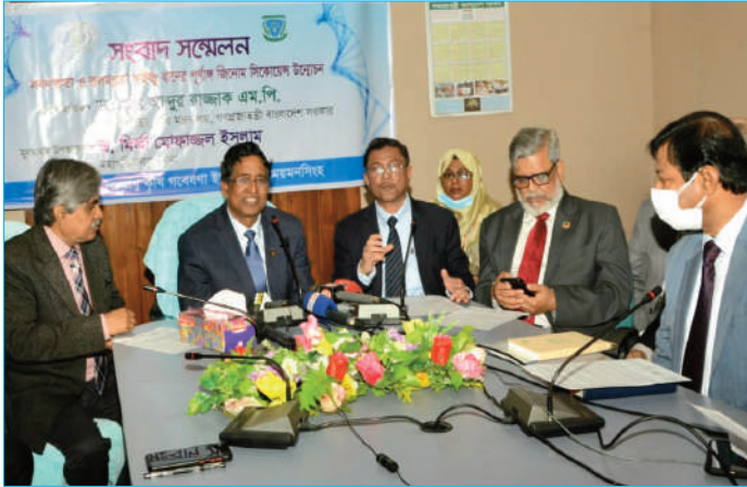
ময়মনসিংহে বিনায় সংবাদ সম্মেলনে প্রধান অতিথি হিসেবে উপস্থিত ছিলেন মাননীয় কৃষিমন্ত্রী ড. মোঃ আব্দুর রাজ্জাক এমপি

দেশে প্রথমবারের মতো লবণাক্ততা ও জলমগ্নতা সহিষ্ণু ধানের পূর্ণাঙ্গ জিনোম সিকোয়েন্স উন্মোচন করেছে বাংলাদেশ পরমাণু কৃষি গবেষণা ইনস্টিটিউট (বিনা) ও বাংলাদেশ কৃষি বিশ্ববিদ্যালয়ের বিজ্ঞানীরা। এর ফলে লবণাক্ততা ও জলমগ্নতা সহিষ্ণু ধান গবেষণায় নতুন দিগন্তের সূচনা হবে বলে সংবাদ সম্মেলনে জানান হয়। মাননীয় কৃষিমন্ত্রী ড. মোঃ আব্দুর রাজ্জাক এমপি ২৩ ডিসেম্বর ২০২১ ময়মনসিংহে বিনায় এ সংবাদ