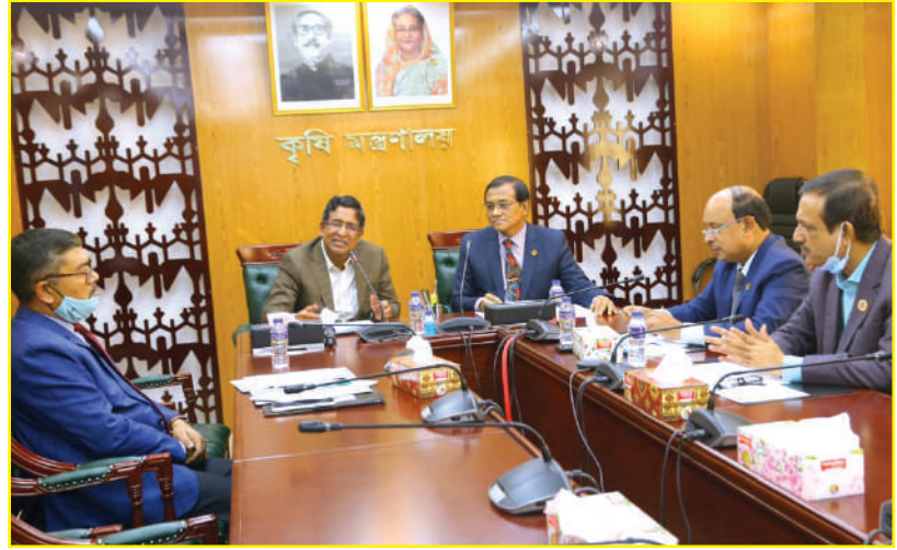
কৃষি মন্ত্রণালয়ের সম্মেলন কক্ষে এডিপি বাস্তবায়ন অগ্রগতি পর্যালোচনা সভায় বক্তব্য রাখছেন মাননীয় কৃষিমন্ত্রী ড. মোঃ আব্দুর রাজ্জাক এমপি