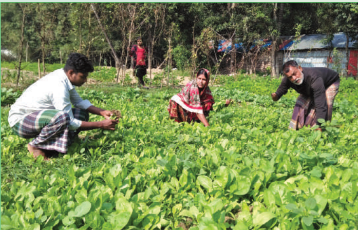
নিজের সবজিক্ষেত্রে কৃষক প্রবির বিশ্বাস