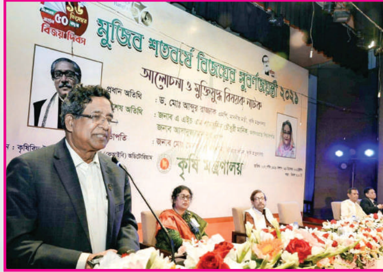
কৃষিবিদ ইনস্টিটিউশন বাংলাদেশ মিলনায়তনে মুজিব শতবর্ষে বিজয়ের সুবর্ণজয়ন্তী উপলক্ষ্যে কৃষি মন্ত্রণালয় আয়োজিত অনুষ্ঠানে প্রধান অতিথির বক্তব্য রাখছেন মাননীয় কৃষিমন্ত্রী ড. মোঃ আব্দুর রাজ্জাক এমপি

তলাবিহীন বুড়ির বাংলাদেশ আজ খাদ্যে পরিপূর্ণ এবং দেশে কেউ না খেয়ে থাকে না-বিজয়ের ৫০ বছরে এটিই সবচেয়ে বড় অর্জন বলে মন্তব্য করেছেন মাননীয় কৃষিমন্ত্রী ড. মোঃ আব্দুর রাজ্জাক এমপি। তিনি বলেন, বাংলাদেশ খাদ্য ঘাটতির দেশ হিসাবে পরিচিত ছিল। স্বাধীনতার পর ৭ কোটি মানুষের জন্য পর্যাপ্ত খাবার ছিল না। আর এখন প্রায় ১৭ কোটি মানুষের দেশে খাদ্যের কোন ঘাটতি নেই। ঢাকায় কৃষিবিদ ইনস্টিটিউশন বাংলাদেশ মিলনায়তনে ২২ ডিসেম্বর ২০২১ বুধবার বিকেল মুজিব শতবর্ষে বিজয়ের সুবর্ণজয়ন্তী উপলক্ষ্যে কৃষি মন্ত্রণালয় আয়োজিত আলোচনা সভা ও নাট্যাৱুষ্ঠানে প্রধান অতিথির বক্তব্যে