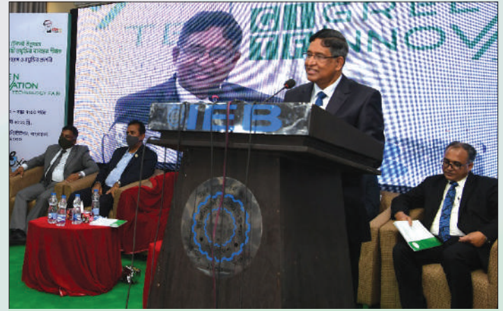
অনুষ্ঠানে বক্তব্য রাখছেন মাননীয় কৃষিমন্ত্রী ড. মোঃ আব্দুর রাজ্জাক এমপি

মাননীয় কৃষিমন্ত্রী ও আওয়ামী যান্ত্রিকীকরণ ত্বরান্বিত করতে লীগের প্রেসিডিয়াম সদস্য ড. কৃষকদেরকে ৫০-৭০% ভর্তুকিতে কৃষি যন্ত্রপাতি দিচ্ছে। এই ভর্তুকি বা মোঃ আব্দুর রাজ্জাক এমপি কৃষি যন্ত্রপাতি দিচ্ছে। এই ভর্তুকি বা বলেছেন, বর্তমান সরকার কৃষি প্রণোদনা দেয়ার ফলে দেশে দ্রুত